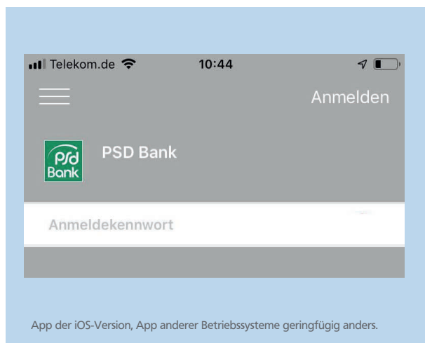
App der iOS-Version, App anderer Betriebssysteme geringfügig anders.

» Öffnen Sie die App. Melden Sie sich mit Ihrem PSD-Key und Ihrer Bankleitzahl an. Legen Sie ein Anmeldekennwort für die SecureGo-App fest. Das Kennwort benötigen Sie künftig für jede Anmeldung in der SecureGo-App.